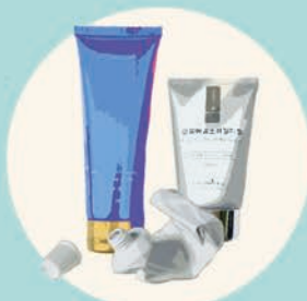
TUBETTI (creme, dentifricio, gel...)