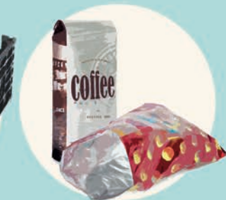
SACCHETTI (patatine, caffè...)