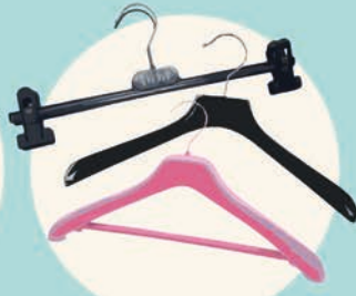
ATTACCAPANNI appendini, grucce...