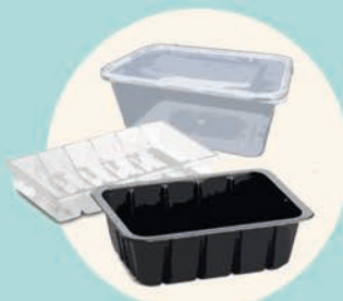
CONFEZIONI RIGIDE scatole trasparenti, vassoi interni per dolci...