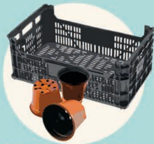
CASSETTE MERCATALI imballaggi per frutta, vasi