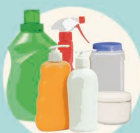
FLACONI E BARATTOLI (detersivi, shampoo, sapone liquido, creme...)