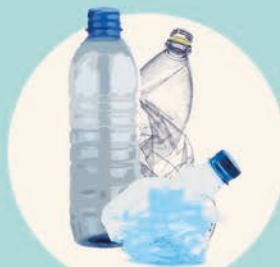
BOTTIGLIE E TAPPI (acqua minerale, latte, bibite, succhi di frutta...)