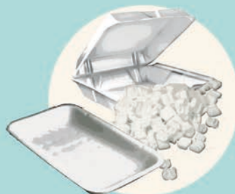
POLISTIROLO per vassoi, imballaggi...