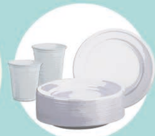
PIATTI E BICCHIERI bianchi, colorati, trasparenti...